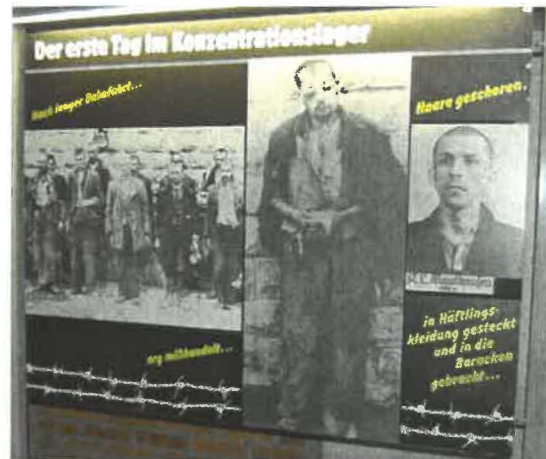
Abb. 7: Ausstellungstafel

Der Gebrauch von NS-Terminologie wird im Text mittels Anführungszeichen deutlich gemacht und die Bedeutung dieser Begriffe wird erklärt. Ein Beispiel hierfür ist die Ausstellungstafel „Sonderbehandlung“, auf der der Bereichstext den NS-Begriff folgendermaßen erklärt: