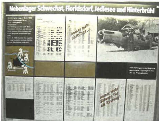
Abb. 6: Ausstellungstafel