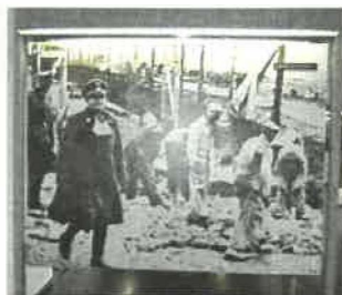
Abb. 4: „Hoher SS-Führer inspiziert arbeitende Häftlinge“

Beim Betreten des Museums sticht zum einen ein vergrößertes Foto, das mit dem Text „Hoher SS-Führer inspiziert arbeitende Häftlinge“ versehen ist und andererseits das Leitsystem, welches sich in Form von gelben Pfeilen am Boden darstellt und durch das gesamte Museum führt, ins Auge.