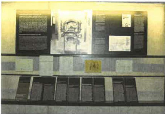
Abb.2: Inbetriebnahme d. ersten Krematorien Ofens

Die Ausstellungsgestaltung, welche sich in Form von Wandtafeln mit schwarzen Hintergrund und weißer Schrift in Kombination mit Fotografien, Skizzen oder Plänen (die in die Wandtafel eingearbeitet sind), setzt kaum auf die „Macht“ des Visuellen sondern eher auf die Kombination von Text und Bild. Die Texte versuchen generell eine klare Botschaft zu transportieren und lassen auch Platz für eigene Fragestellungen. Die Position der AutorInnen oder der Institution wird ausgeblendet und in keiner Form der Textgestaltung sichtbar gemacht.