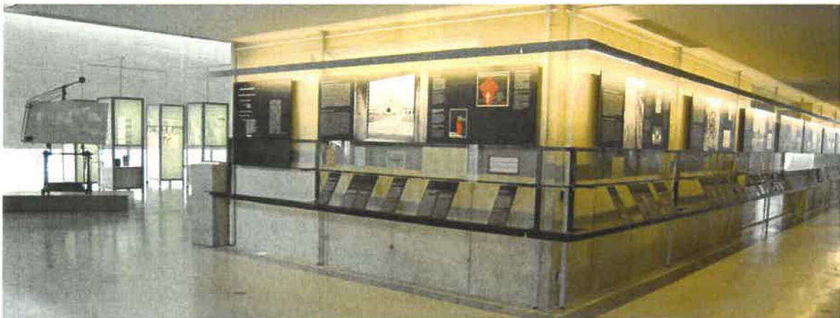
Abb. 1: Ausstellungsansicht „Krematorien von Mauthausen“ und „Techniker der ‚Endlösung‘“

In der Ausstellung werden folgende Themen behandelt: „Feuerbestattung in Österreich vor 1938“, „Aufbauphase des Konzentrationslagers Mauthausen“, „Inbetriebnahme des ersten Krematoriums Ofens 1940“, „Errichtung eines Krematoriums im Konzentrationslager Gusen“, „Krematorien als Funktionselement des Massenmordes“, „Expansion des Lagersystems und neue Krematorien“, „Massengräber und Ausbau der Krematorien vor der Befreiung“, „Sichtbarkeit des Massenmordes“, „Krematorien als Beweisgegenstand“ und „Objekte der Erinnerungskultur“. Die Anordnung und Strukturierung wurde sowohl nach thematischen Schwerpunkten ausgeführt als auch chronologisch geordnet.