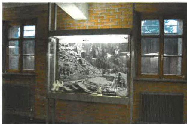
Abb. 5: Ausstellungsansicht Keller

Die Ausstellung thematisiert die gesamte Geschichte des ehemaligen Konzentrationslagers Mauthausen sowie einzelner Nebenlager und ist in folgende Themenbereiche aufgeteilt: „Machtergreifung und Wirtschaftsimperium der Nationalsozialisten“, „Beginn und Aufbau des ehemaligen Konzentrationslagers Mauthausen“, „ausgewählte Nebenlager“, „Häftlinge und Häftlingsgruppen“, „Alltag der Häftlinge“, „Foltermethoden“, „Widerstand