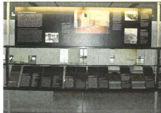
Abb.3: Funktionselement des Massenmordes

Jene Exponate, die hinter der Plexiglaswand präsentiert werden, erwecken den Eindruck, dass es sich hierbei um Originalobjekte handelt – dies geht aber aus den darunter angebrachten Objektbeschriftungen nicht hervor. Sie erhalten durch diese Positionierung einen höheren Stellenwert im Vergleich zu den Materialien, die in die Ausstellungswand integriert sind. Die Objekttexte bekommen durch die Art des Designs selbst Objektcharakter zugeschrieben. Der Themenbereich „Krematorien als Funktionselement des Massenmordes“ sticht durch den Hintergrund einer Glaswand, im Gegensatz zur Mauer der anderen Bereiche, hervor und erzeugt so die Möglichkeit eines Wechselspiels zwischen den Originalobjekten der anderen Sonderausstellung, welche Teile eines Krematorien repräsentieren, und somit einer zusätzlichen Illustration des Themas dienen.