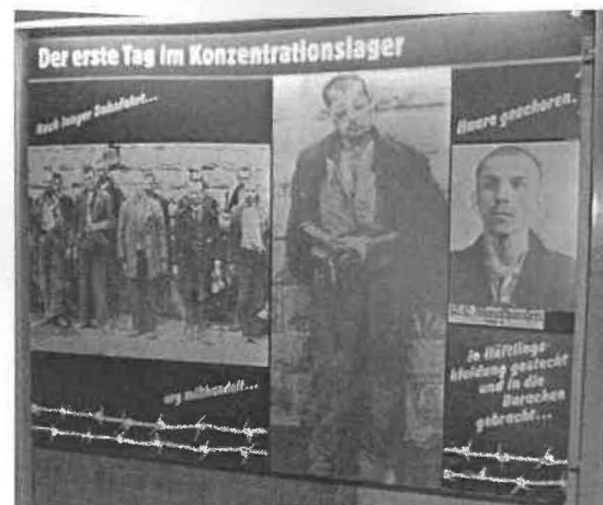
Abb. 7: Ausstellungstafel

Der Gebrauch von NS-Terminologie wird im Text mittels Anführungszeichen deutlich gemacht und die Bedeutung dieser Begriffe wird erklärt. Ein Beispiel hierfür ist die Ausstellungstafel „Sonderbehandlung“, auf der der Bereichstext den NS-Begriff folgendermaßen erklärt: